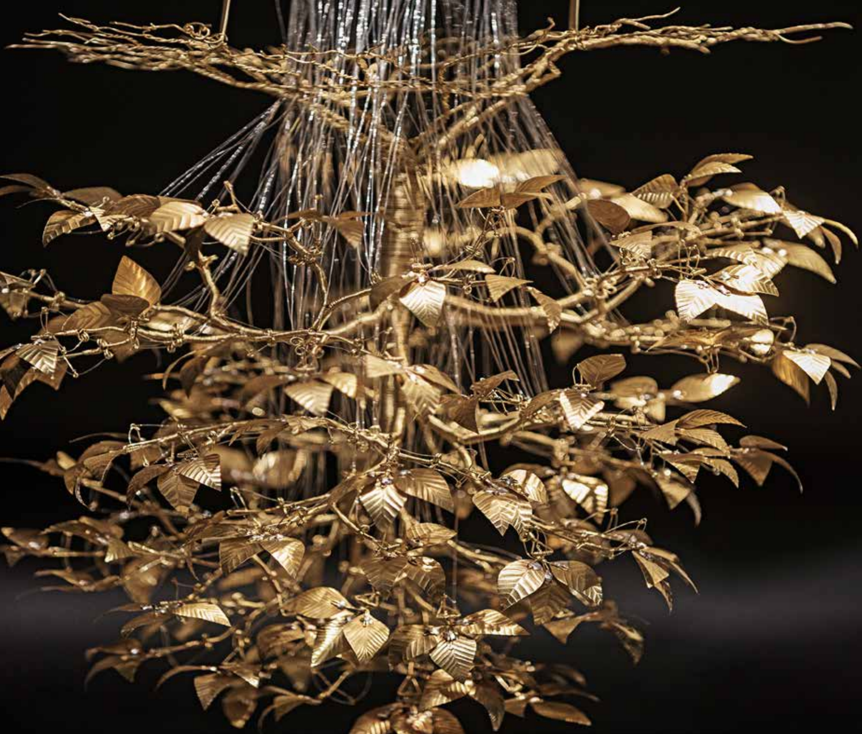
Arbre de la vida, Casey Curran Seattle, Washington 15 d'Agost, 2016