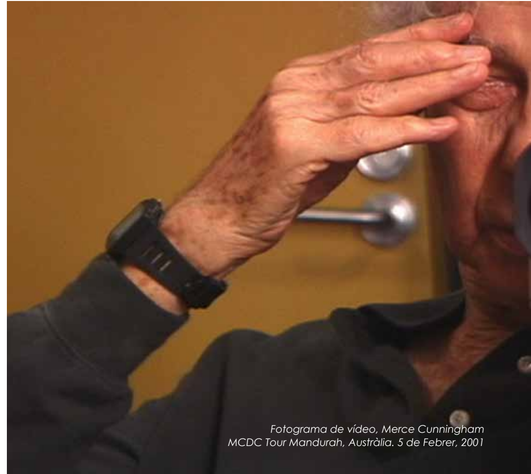
Fotograma de vídeo, Merce Cunningham MCDC Tour Mandurah, Austràlia. 5 de Febrer, 2001