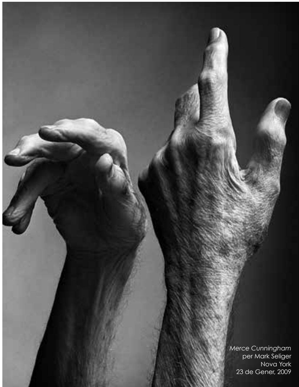
Merce Cunningham Nova York 23 de Gener, 2009